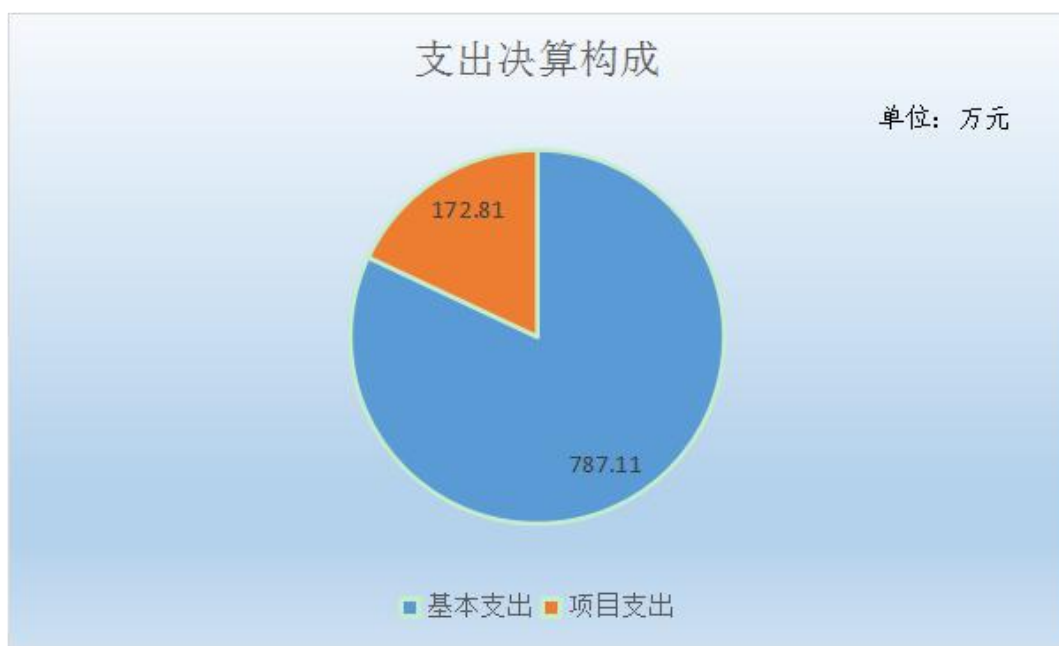
图 2：2021 年支出决算构成情况

本单位 2021 年度本年支出合计 959.92 万元，其中：基本支出 787.11 万元，占 82.00%；项目支出 172.81 万元，占 18.00%。 如图所示：